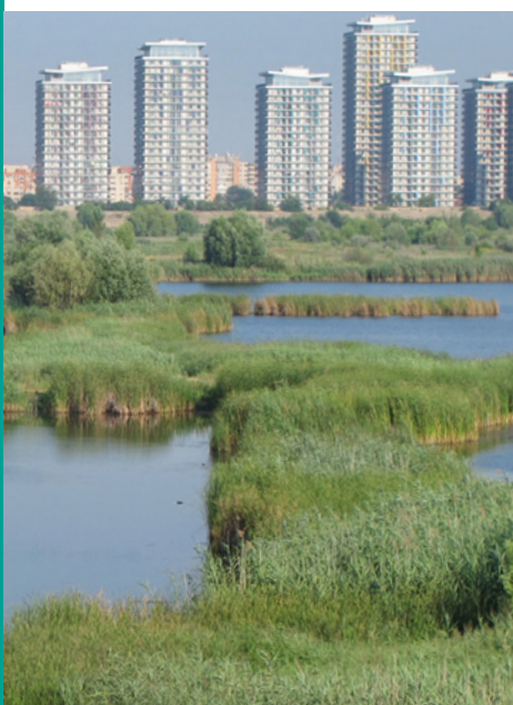
El Índice de Extensión de los Humedales (Wetlands Extent Index)